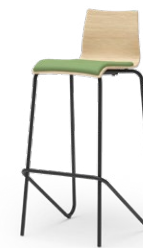
ATICON 28 STAPEL-BARHOCKER STAHLROHRGESTELL | HOLZSCHALE