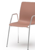
ATICON 751 STAPELSTUHL STAHLROHRGESTELL | HOLZSCHALE