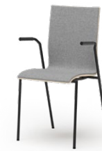
ATICON 734 | 744 STAPELSTUHL STAHLROHRGESTELL | HOLZSCHALE