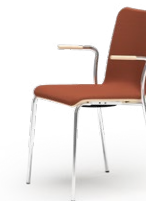
ATICON 165 STAPELSTUHL STAHLROHRGESTELL | HOLZSCHALE