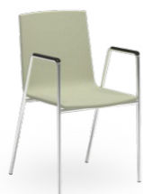
ATLANTA 452 STAPELSTUHL STAHLROHRGESTELL | HOLZSCHALE