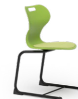
ATLANTA 760 STAPELSTUHL STAHLROHRGESTELL | KUNSTSTOFFSCHALE | HOLZSCHALE