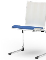
ATLANTA 66/67 STAPELSTUHL STAHLROHRGESTELL | HOLZSCHALE