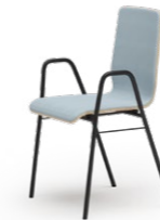
ATLANTA 731 STAPEL-REIHENSTUHL STAHLROHRGESTELL | HOLZSCHALE