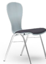
ATLANTA 55 STAPEL-REIHENSTUHL STAHLROHRGESTELL | HOLZSCHALE