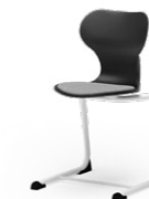
ATLANTA 750 STAPELSTUHL STAHLROHRGESTELL | KUNSTSTOFFSCHALE | HOLZSCHALE