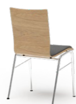
ATLANTA 50 STAPEL-REIHENSTUHL STAHLROHRGESTELL | HOLZSCHALE