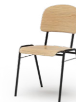
ATLANTA 711 3171 STAPEL-REIHENSTUHL STAHLROHRGESTELL | HOLZ SITZ UND RÜCKEN