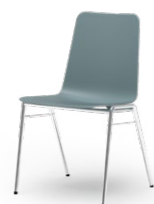
ATLANTA 456 STAPEL-REIHENSTUHL STAHLROHRGESTELL | KUNSTSTOFFSCHALE