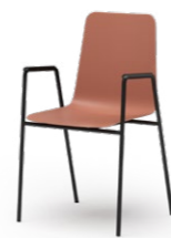
ATLANTA 452 STAPELSTUHL STAHLROHRGESTELL | KUNSTSTOFFSCHALE