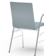
ATLANTA 735 STAPEL-REIHENSTUHL STAHLROHRGESTELL | HOLZSCHALE