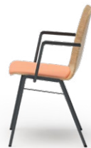
ATLANTA 450 STAPEL-REIHENSTUHL STAHLROHRGESTELL | HOLZSCHALE