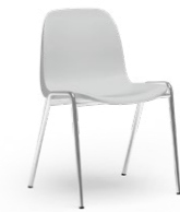
ATLANTA 709 STAPEL-REIHENSTUHL STAHLROHRGESTELL | KUNSTSTOFFSCHALE