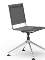
BLAQ 474 KONFERENZSTUHL ALUMINIUM-FUSSKREUZ | NETZSCHALE