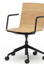
BLAQ 476 DREHSTUHL ALUMINIUM-5ER FUSSKREUZ | HOLZSCHALE