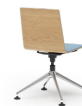
BLAQ 477 KONFERENZSTUHL ALUMINIUM-FUSSKREUZ | HOLZSCHALE