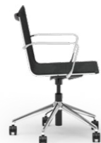
BLAQ 470 DREHSTUHL ALUMINIUM-5ER FUSSKREUZ | NETZSCHALE