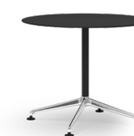
BLAQ 470 BISTROTISCH ALUMINIUM-FUSSKREUZ | MITTELSÄULENTISCH