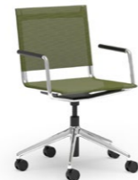
BLAQ 472 DREHSTUHL ALUMINIUM-5ER FUSSKREUZ | NETZSCHALE