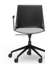
BLAQ 478 DREHSTUHL ALUMINIUM-5ER FUSSKREUZ | KUNSTSTOFFSCHALE