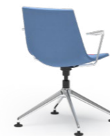
BLAQ 479 KONFERENZSTUHL ALUMINIUM-FUSSKREUZ | KUNSTSTOFFSCHALE