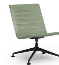
BLAQ 475 LOUNGESESSL ALUMINIUM-FUSSKREUZ | VOLLPOLSTERSCHALE