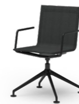
BLAQ 473 KONFERENZSTUHL ALUMINIUM-FUSSKREUZ | NETZSCHALE