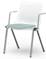
BLAQ 468 STAPEL-REIHENSTUHL STAHLROHRGESTELL | KUNSTSTOFFSCHALE