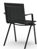
BLAQ 460 | 462 STAPEL-REIHENSTUHL STAHLROHRGESTELL | NETZSCHALE