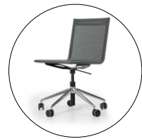
BLAQ 470 durchgängiger Netzrücken