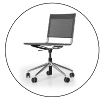
BLAQ 472 geteilter Netzrücken