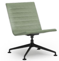
BLAQ 475 LOUNGESESSL ALUMINIUM-FUSSKREUZ | VOLLPOLSTERSCHALE