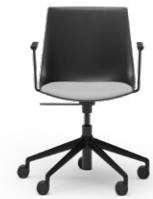
BLAQ 478 DREHSTUHL ALUMINIUM-5ER FUSSKREUZ | KUNSTSTOFFSCHALE