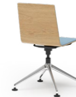
BLAQ 477 KONFERENZSTUHL ALUMINIUM-FUSSKREUZ | HOLZSCHALE