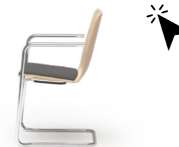
LOGOCHAIR 443 FREISCHWINGER STAHLROHRGESTELL | HOLZSCHALE