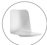
Schale 495 Schale 495/1