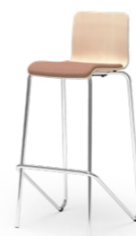
LOGOCHAIR 29 STAPEL-BARHOCKER STAHLROHRGESTELL | HOLZSCHALE