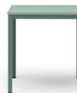
LOGOTABLE 306 | 307 VIERFUSSTISCH STAHLROHRGESTELL