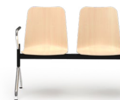
LOGOCHAIR 599 BANKSYSTEM STAHLROHRGESTELL | HOLZSCHALE