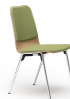
LOGOCHAIR 495 STAPELSTUHL STAHLROHRGESTELL | HOLZSCHALE