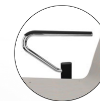
Armauflage Kunststoff schwarz