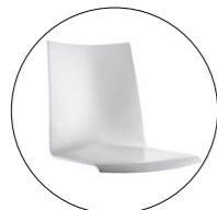
Schale 496 Schale 496/1