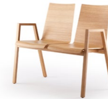
PAN 392 | 393 2ER BANK MASSIVHOLZGESTELL | HOLZSCHALE