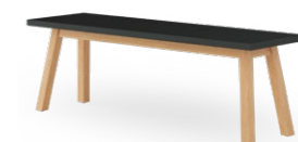
PAN 3910 BANK