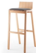
PAN 394 BARHOCKER MASSIVHOLZGESTELL | HOLZSCHALE