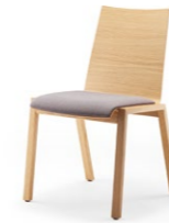
PAN 390 | 391 STAPEL-REIHENSTUHL | HOCHLEHNER MASSIVHOLZGESTELL | SPERRHOLZ, POLSTER