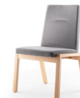
PAN 398 | 399 STAPEL-REIHENSTUHL | SCHWERLAST-STUHL MASSIVHOLZGESTELL | VOLLPOLSTER