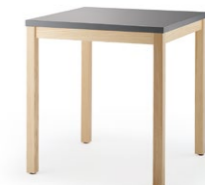
PAN 3900 VIERFUSSTISCH