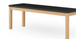
PAN 3900 BANK