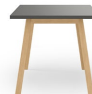
PAN 3910 VIERFUSSTISCH