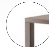
Galeries rectangulaires 410