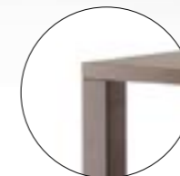
Galerie carrée 411