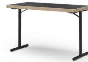
DELTA 110 KLAPPTISCH STAHLROHRGESTELL