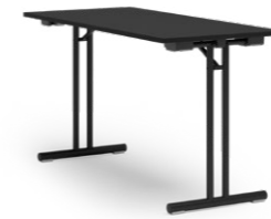
DELTA 105 KLAPPTISCH STAHLROHRGESTELL