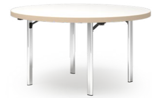
DELTA 159 KLAPPTISCH STAHLROHRGESTELL