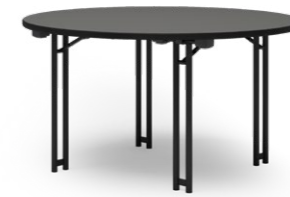
DELTA 158 KLAPPTISCH STAHLROHRGESTELL